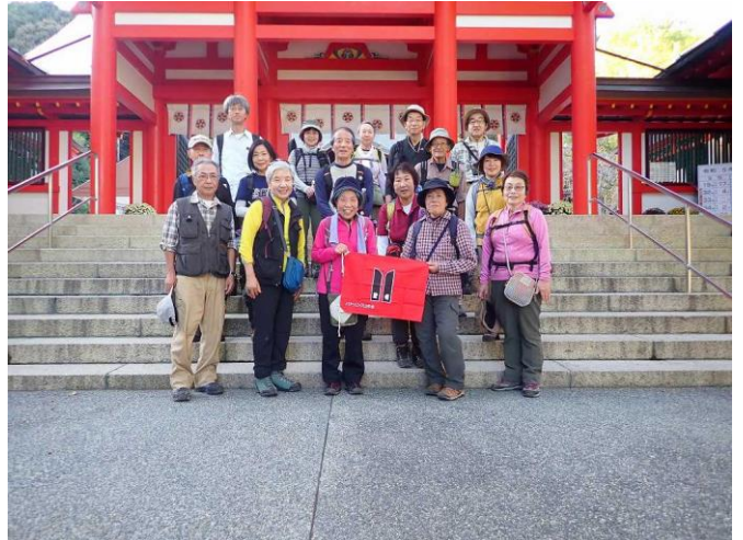
11月 紅葉例会 金勝アルプス