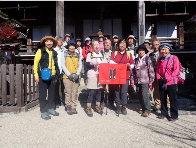
11月 東海自然歩道例会 No.10